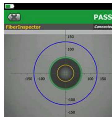
Los defectos que pasan los requisitos del estándar son de color verde